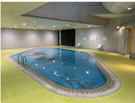
幼児用プール 水深 55 cm