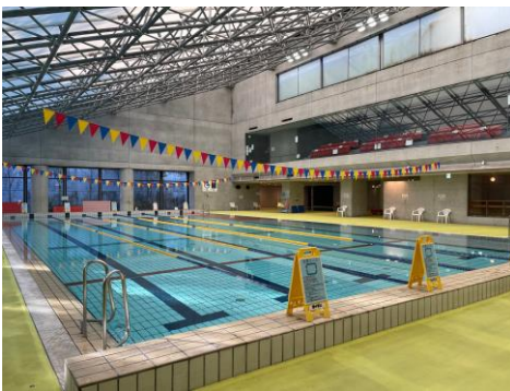
競泳用プール 25m×6 コース ※公益財団法人日本水泳連盟公認 25mプール 水深 120 cm～140 cm